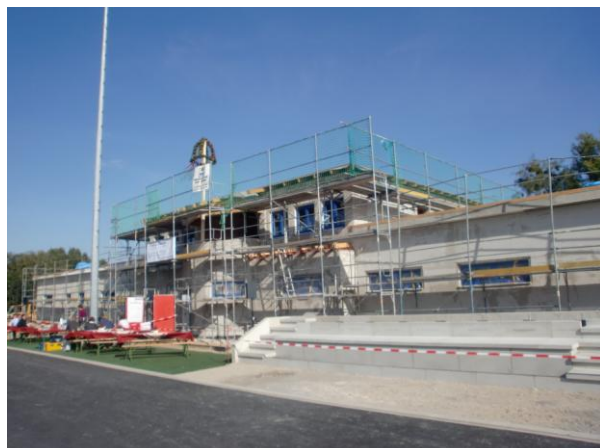
Neubau des Sozialgebäudes

Dieses Vorhaben ist mit Mitteln des Landkreises und der Kommune finanziert.