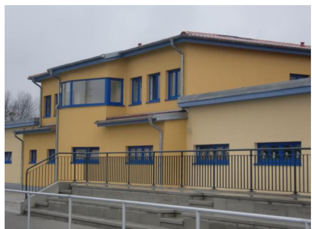
Sprecherkabine und Umkleiden